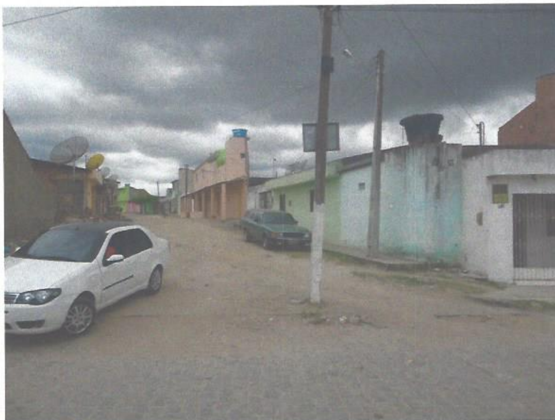
Poste entre as RUAS MARCOS TELMO TENÓRIO e SANTOS DUMONT situadas no BAIRRO IPIRANGA , município de AGRESTINA . Poste Nº C – 215536.