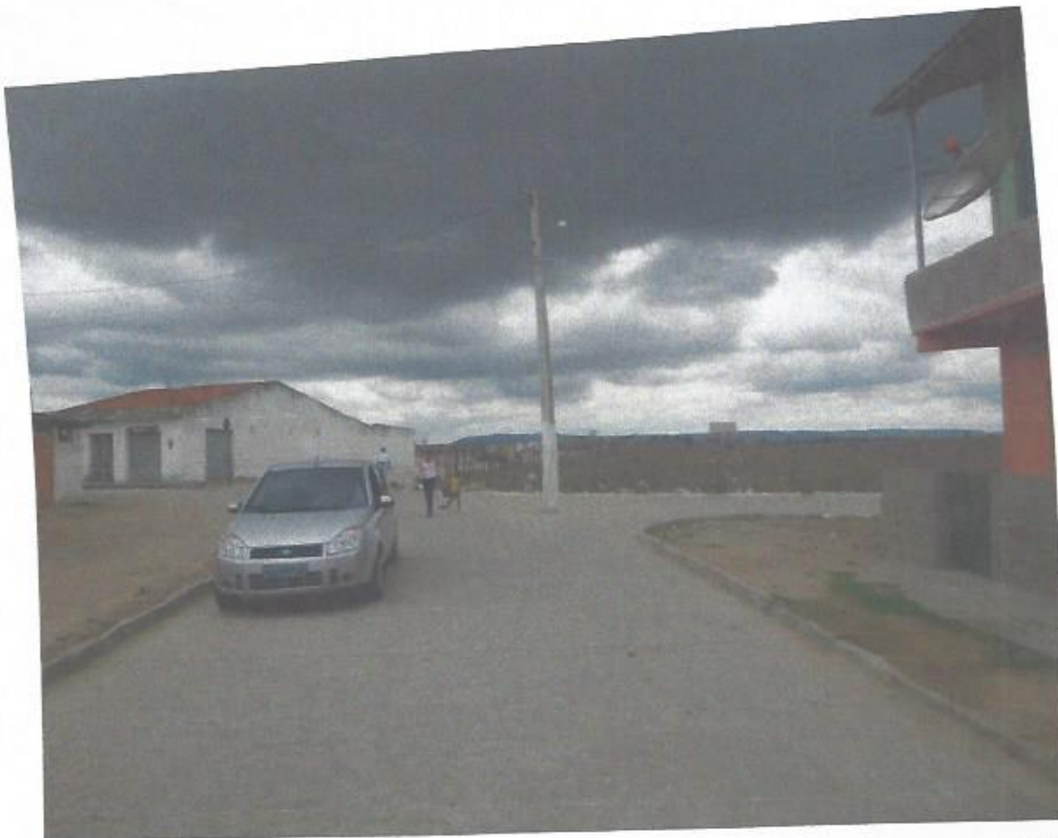
Poste entre as RUAS IDALINO HENRIQUE RIBEIRO e SANTOS DUMONT situadas no BAIRRO IPIRANGA , município de AGRESTINA . Poste Nº C – 215569.