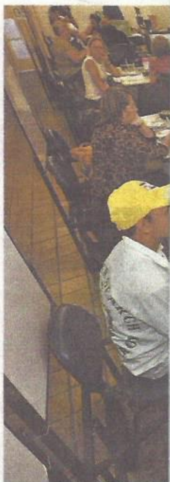
Justiça Eleitoral espera até

Cinco Pontas tem capacidade para atender 1,2 mil pessoas por dia