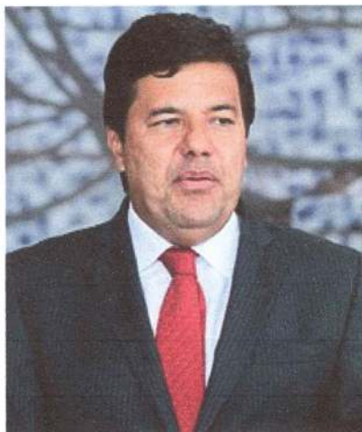
Mendonça Filho em 2013.